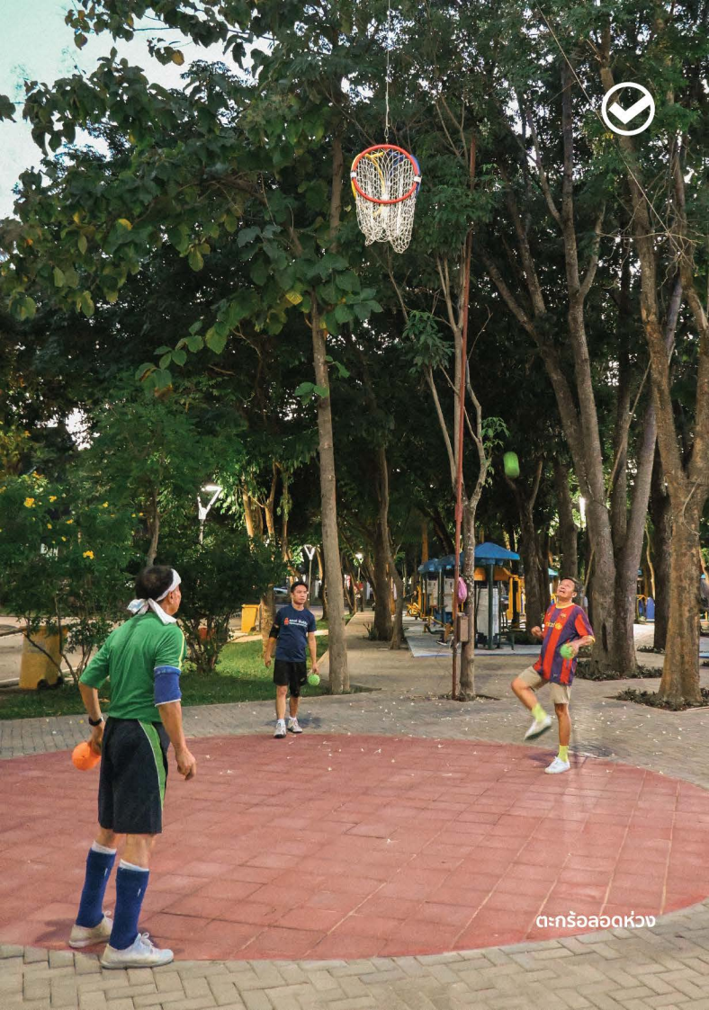
ตะกร้อลอดห่วง