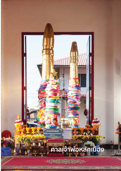
ศาลเจ้าพ่อหลักเมือง