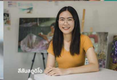
สีสันสตูดิโอ