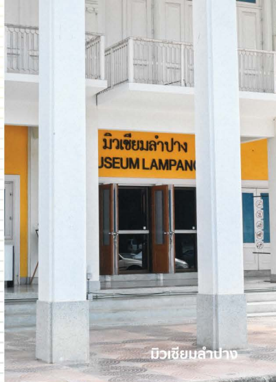
มิวเซียมลำปาง