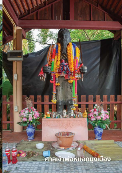
ศาลเจ้าพ่อหมอกมุงเมือง