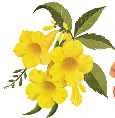
ดอกทองอุไร