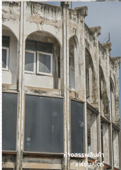
ห้างสรรพสินค้า แฟชั่นสตรี