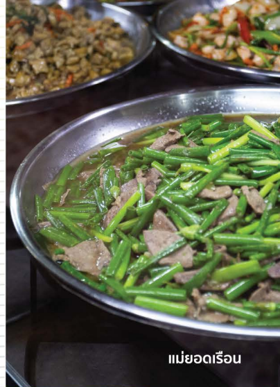
แม่ยอดเรือ