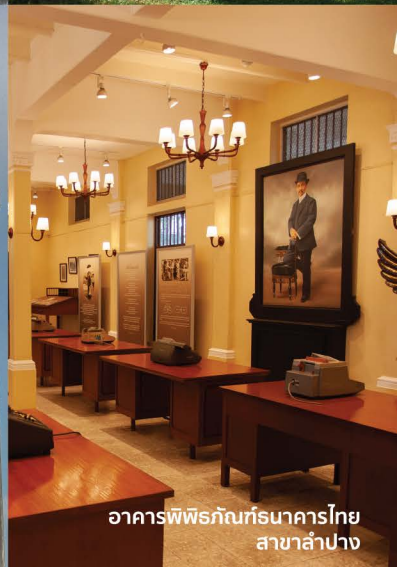
อาคารพิพิธภัณฑ์ธนาคารไทย สาขาลำปาง