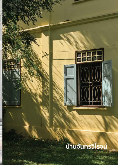
บ้านจันทรวีโรจน์