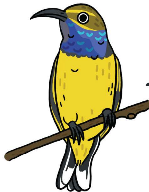
นกกินปลือกเหลือง