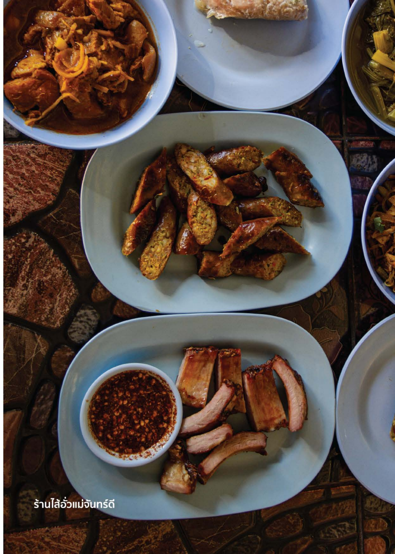
ร้านโล่ฮั่วเม่จันตรีดี