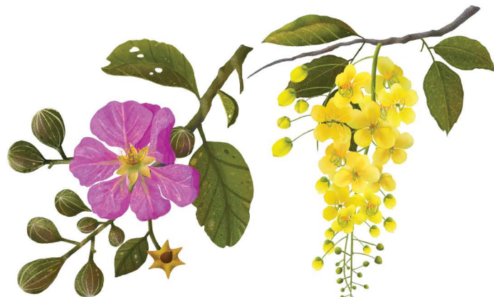
ต้นอินทนิล