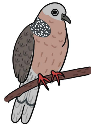
นกเขาใหญ่