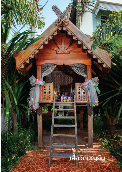
เสือวัดบุญยืน