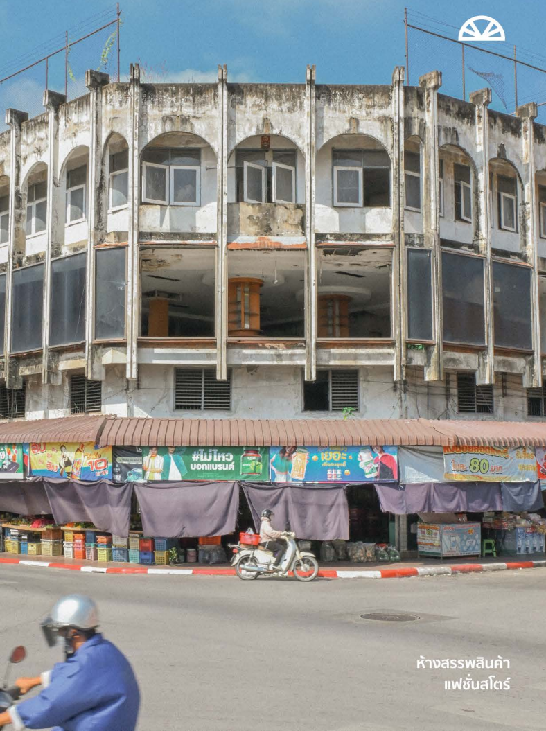
ห้างสรรพสินค้า แฟชั่นสตรี