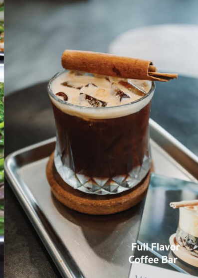
Full Flavor Coffee Bar