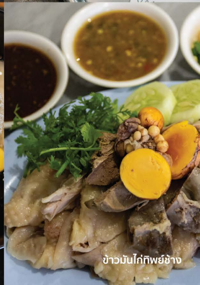
ข้าวมันไก่กัศยช่าง