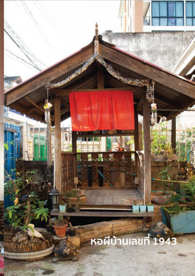
หอผีบ้านเลขที่ 1943