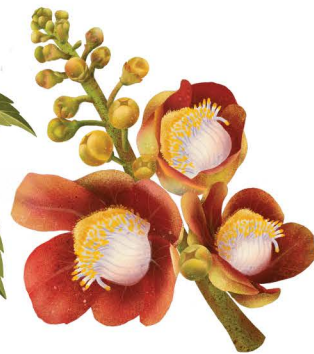
ต้นสาละลิงกา