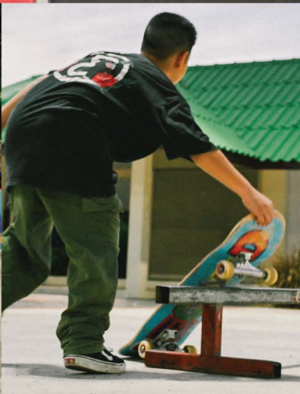
สเก็ตบอร์ด